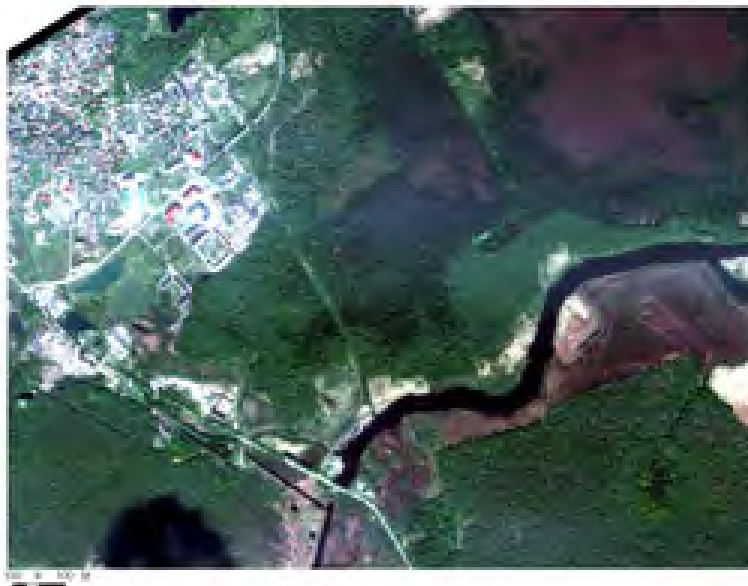
Рис. 2. Пример изображения территории исследования со спутника QuickBird.

Основные преимущества использования ДДЗ для составления карт: актуальность данных на момент исследования, высокая точность определения границ объектов, более высокий коэффициент объективности выделения объектов и отнесения объекта к определенному таксону. Кроме этого использование ДДЗ позволяет сократить объем наземных исследований, и таким образом сократить сроки исследования. Явным плюсом применения выше описанных технологий автоматического дешифрирования ДДЗ является доказуемость (прозрачность) получаемых результатов картирования.