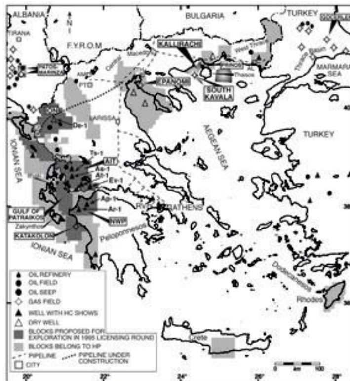
Рис. 1 Разведка и добыча в Греции и соседних странах. Также показаны лицензионные участки, основные скважины, выходы нефти и города, упомянутые в тексте (AIT = Aitolokarnania, AL = Alexandroupolis, AM = Amyntaio, Ap-1 = Apollo-1, Ar-1 = Artemis-1, As-1 = Astakos-1, At-1 = Aitolokarnania-1, De-1 = Demetra-1, Ev-1 = Evinos-1, IG = Igoumenitsa, ION = Ioannina, PT = Ptolemais, TH = Thessaloniki, Ts-1 = Trifos South-1, RV = Revithousa).

Нефть: нефтяная промышленность Греции находится во власти государственной компании Hellenic Petroleum (HP), которая была сформирована в 1998 из другой, существовавшей ранее, государственной нефтяной компании Public Petroleum Corporation (DEP). HP проводит разведку на нефть, импортирует сырье и продукты, управляет двумя большими нефтеперерабатывающими заводами, а также распределяет и продает нефтепродукты. Хотя нефтяной рынок Греции был открыт для конкуренции, HP продолжает доминировать над внутренним рынком. HP к июню 2001 закончил строительство трубопровода длиной 143 мили и стоимостью 100 миллионов $ для транспортировки сырой нефти от северного портового города Салоники до своего недавно приобретенного нефтеперерабатывающего завода Окта около Скопье, в Бывшей Югославской Республике Македония (БЮРМ) (рис. 1). Трубопроводом будут управлять совместно с БЮРМ,