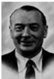
Карло Инполито Мильорини немного за пятьдесят.

(горообразования), включающей начальную фазу продольного сжатия коры, орогенные сдвиги и последующее изостатическое выравнивание. Через годы его идеи развились в три столпа геологической мудрости, которые мы приводим здесь по отдельности, но на самом деле они суть составные части единого уникального взгляда на движения в Земле.