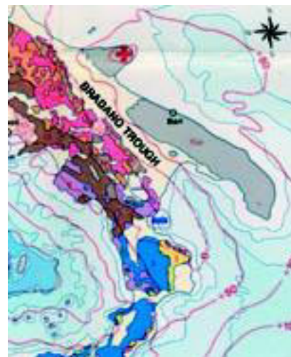
Упрощенная карта поля силы тяжести впадины Брадано (фрагмент Карты силы тяжести Италии, CNR 1991).

Мильорини развивал теорию нарастания складчатости и орогенных оползней в сторону динамики процессов, что привело к созданию, в основном на материале полевых исследований, модели строения центральной части Апеннин. Теория составных клиньев появилась сразу после Второй мировой войны в 1946 г. и окончательно сформулирована в 1948 г. (I Cunei Composti nell'Orogenesi, Pubblicazione No. 2 del Centro Studi Geologici dell'Appennino, C.N.R. & Bollettino Societa Geologica Italiana LXVII). В то время подвижность континентальной коры еще не рассматривалась в рамках концепции тектоники плит, которая тогда, к началу 1950-х годов, еще только формировалась.