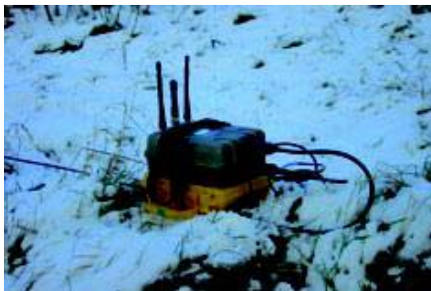
УУС аппаратуры itSystem .

Во многих регионах, особенно на Западе, сейсморазведочные работы не разрешаются из-за необходимости получения разрешений или природоохранных ограничений. В этих ситуациях использование «щадящей сейсморазведки» с легким оборудованием и малочисленными полевыми отрядами позволило бы все же провести такие работы. Для примера назовем работы независимой компании LaMesa Geophysical, которая работает на территории Barnett Shale plays в Северном Техасе и в Оклахоме. Участки работ в регионе обычно имеют малые размеры и сложную форму. Получить разрешение на работы довольно сложно. Гибкость оборудования упрощает проведение работ на таких участках. Компании La Mesa за несколько дней удалось провести серию работ на таких сложных участках, сократив при этом численность полевых отрядов.