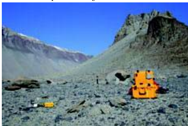
Испытания аппаратуры itSystem на марсианском полигоне НАСА (сухое русло в Антарктиде).