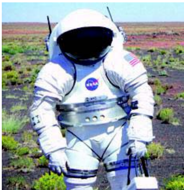
Компания Vibtech совместно с НАСА проводит испытания в США и в Антарктиде.