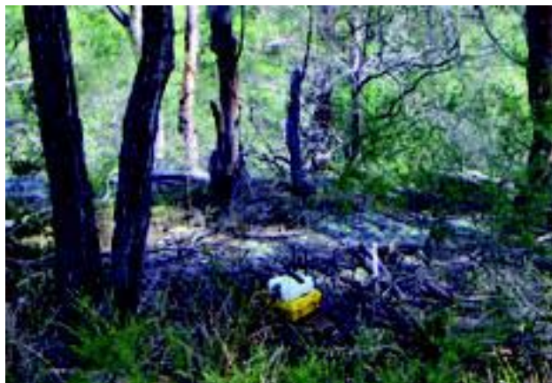
Работы в австралийском буше

Unite создана как «самопозиционирующаяся» система, что позволит сократить время на топографическую привязку, поскольку, благодаря встроенным устройствам позиционирования, положение каждого УУС Unit будет всегда известно.