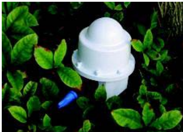
УЧС Unit со встроенными антенной и батареей.

Возможно, самой привлекательной чертой аппаратуры Unite является «пакет опций», позволяющий пользователю изменять систему под свои нужды, например батарея большей емкости, многоканальные УЧС Unit, ЭМ датчики, кабельные интерфейсы и расширенная память. Система Unite полностью совместима с аппаратурой itSystem, пользователи которой могут, таким образом, использовать Unite для модернизации своего оборудования.