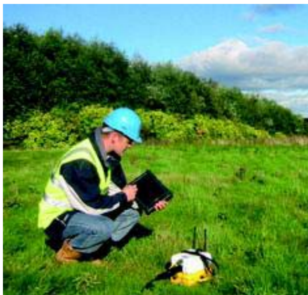
Малогабаритная бескабельная сейсмостанция Min-it.