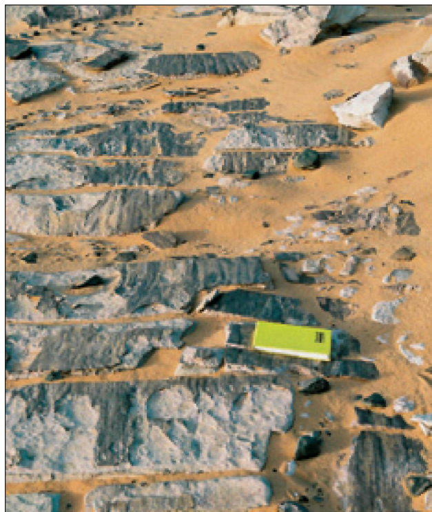
Рисунок 4 Ледовые борозды скольжения в породах верхнеордовикской формации Matiniyat. Максимальное оледенение на территории Ливии произошло в позднем ордовике и именно осадочные породы этого возраста являются лучшими нефтяными резервуарами в бассейне Murzuq.

Палеогеографические реконструкции, произведенные Смитом и Кирки (Smith and Kirki, 1996), демонстрируют формирование мелководных морских резервуаров кембрийско-ордовикского возраста, содержащих силурийские сланцы, при этом геометрия резервуаров испытала влияние тектонических напряжений СЗЮВ направления. Эти интервалы не изучены, но сравнение со стратиграфией соседних территорий – платформы Cyrenaica и