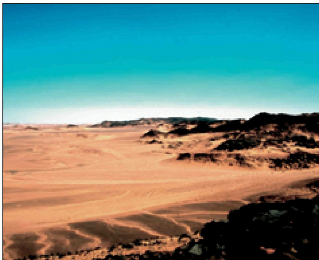
Рисунок 5 Обнажения верхнеордовикских пород формации Matuniyat на северном фланге бассейна Murzuq, в ЮВ Ливии (область Gargaf Arch). Эти породы образуют резервуары в бассейне Murzuq. Кемрийско-ордовикские резервуары приобретают большую важность в бассейнах Ghadames и Kufra, а также на платформе Cyrenaica. Их привлекательность следует из их хорошей проницаемости и тесной связи с перекрывающими силурийскими материнскими породами. юрские осадки. Результаты оказались схожими с нефтяной скважиной на шельфе Binghazi и в этом районе сейчас проводятся активные исследования (по программе мая 2005 г.).

Одна глубоководная скважина была пробурена в заливе Bomba на северо-востоке провинции Cyrenaica, а также на побережье было пробурено несколько скважин в районе бассейна Marmarica. Эти скважины вскрыли