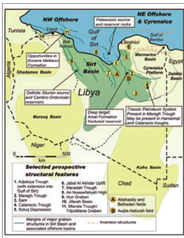
Рисунок 1 Карта, иллюстрирующая ключевые, перспективные и малоисследованные элементы Ливийской тектонически-активной провинции, региона, охватывающего район месторождений Sirt и шельфовые пограничные районы (юго-западный, западный и район Cyrenaica).

Только на 30% территории Ливии проводились поиски месторождений углеводородов. МНК неохотно делали инвестиции в геологоразведку пограничных провинций, однако современная история Ливии доказывает хорошую перспективную выгоду от исследований во вновь открытых палеозойских нефтяных системах. Разведочное бурение в бассейне Murzuq в начале 1980-х и последующее открытие гигантских месторождений, таких как Elephant в 1997, открыли огромную, первоначально принятую как неперспективную, нефтяную провинцию. Потенциал этих старых нефтяных систем, до сих пор плохой понятый и мало эксплуатируемый, громаден.