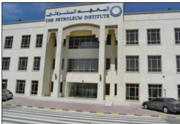
Здание факультета наук о Земле.

Этого, определенно, не было. Из пяти научных программ в PI, факультет наук о Земле имеет меньше всего студентов. Кажется, для этого есть много причин, возможно, некоторые из них мы до сих пор не можем понять. Эти студенты в общей массе хотят быть инженерами. Многие из них не считают, что геологи и геофизики являются инженерами. Студенты также