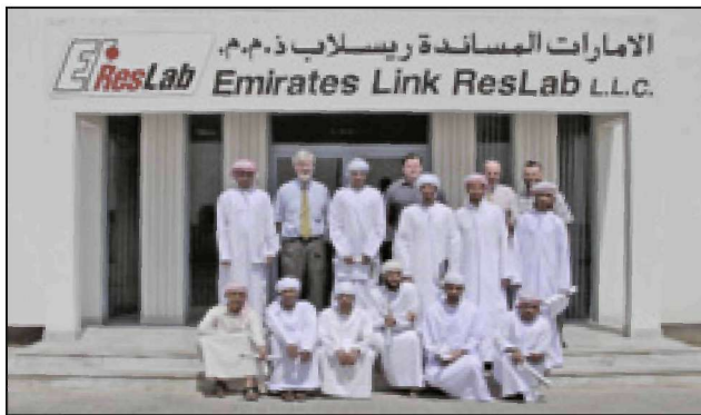
Со студентами у научно-исследовательских лабораторий в Абу-Даби.

план, и может быть аргументирована его значимость, вы, весьма вероятно, получите финансовую поддержку. Она предоставляется поэтапно, то есть вы сначала должны доказать себе, что мы должны принять как достаточно рациональное.