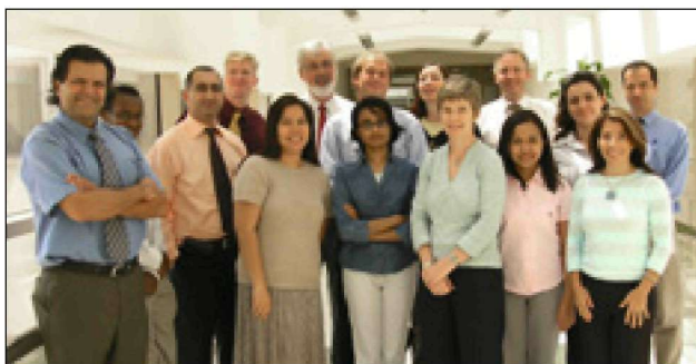
Некоторые студенты нефтяного факультета и преподавательский состав.

Пока PI имеет пять научных программ: электротехника, машиностроение, химическая технология, технология добычи нефти и нефтяная геология. До настоящего времени мы предлагали только получение степени бакалавра, но в стадии появления находятся степени магистра и доктора. В прошлом году мы также начали принимать студентов женского пола. Они учатся в разных корпусах, и студенты противоположных полов не могут видеться на территории института. Мечта PI состоит в том, чтобы обеспечить первоклассное обучение инженерным и прикладным наукам, чтобы поддерживать и продвигать нефтяную и энергетическую отрасли промышленности. Мы стремимся получить международную аккредитацию учебного заведения. Экзамен PI будет приравняться к экзамену любого хорошего европейского или американского университета. В начале это выражалось, что мы теряли много студентов, но теперь кажется, ситуация стабилизируется. Прием студентов этой осенью составил где-то 200 молодых людей и 100 девушек. Примерно 15% из них не из ОАЭ. Колорадская горная школа (Colorado School of Mines) (CSM) сыграла важную роль в становлении данного университета. Главным спонсором является государственная нефтяная компания ОАЭ (Abu Dhabi National Oil Company). Другими корпоративными спонсорами являются Shell, BP, Total и JODCO.