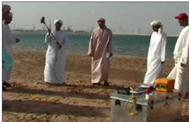
Студенты, выполняющие геофизические эксперименты.

Идущие в настоящее время научно-исследовательские проекты имеют отношение, в основном, к областям геологии карбонатных коллекторов, сейсморазведки методом отраженных волн, физики пород и локальной и региональной геологии. Исследования варьируются от фундаментальных до прикладных, последние отражают потребности нефтяной промышленности, имеющие прочные связи с группой ADNOC и корпоративными партнерами. Предпринятые проекты или находящиеся в процессе включают в себя: