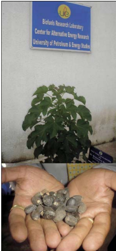
Рисунок 2 Растение сапори (слева) и семена (справа) в Исследовательском Центре Биотоплива, Университет Нефти и энергетических исследований Dehradun, India.

UK находится далеко позади Бразилии и Швеции в смысле правительственной поддержки, но, тем не менее, правительственное стимулирование существует: например, годовая 2% скидка на налоги на автомобиль для автомобилей с био-этаноловым E85 топливом, скидка со сбора на транспортные средства £20 и 20% скидка на топливо до 2010 г.