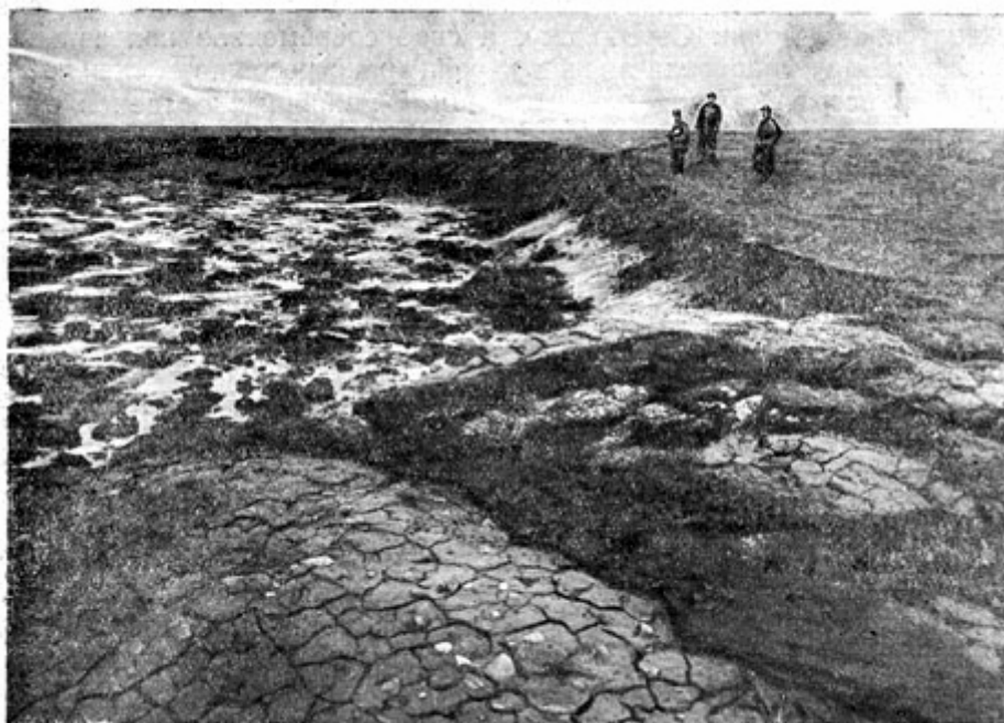
Рис. 49. Ископаемый лед в губе Крестовой; на переднем плане полигональные почвы.

Торфяники в Крестовой губе были специально изучены М.М. Юрьевым (1925). Пропласток торфа среди глин, мощностью всего 2—3 см, заключал в себе остатки Нурпит, Sphagnum , Betula папа, пыльцу Betula adorata , Carex . Глины над торфом имеют делювиальное происхождение, глины под торфом, налегающие на ископаемый лед, — морские. Торф, судя по присутствию Sphagnum и Betula папа, образовался при климате теплее современного (в ксеротермический период послеледниковое время).