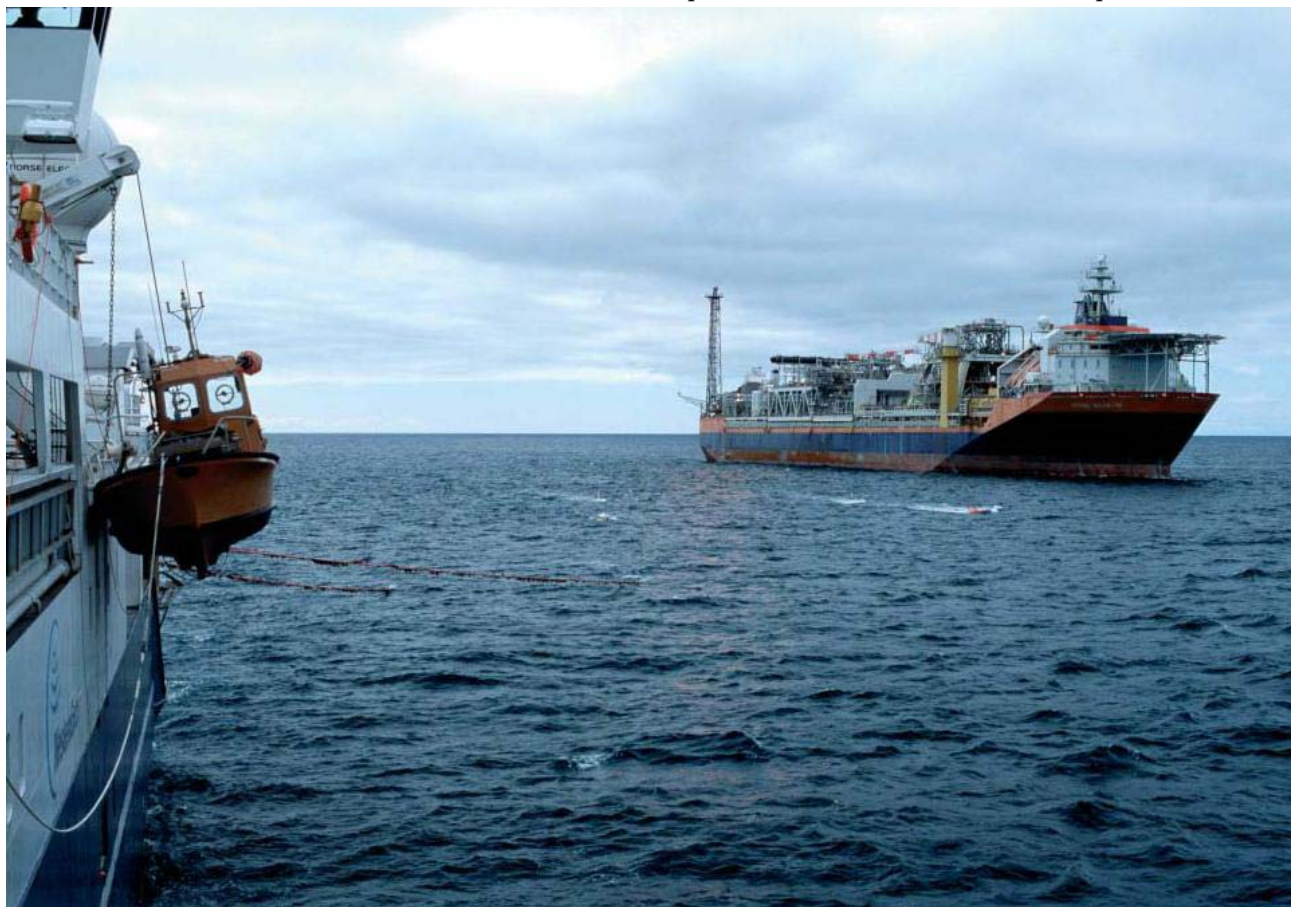
4Дсейсморазведка на поле Норн: если присмотреться, видно, как близко расположена коса к плавучей системе нефтедобычи. Столь плотное покрытие возможно, главным образом, благодаря управляемой косе, применяемой в морской Q-системе.

Q-технологии –отличительная черта WesternGeco – долго развивались внутри Schlumberger и в 2001 г. были представлены в качестве системы сбора данных нового