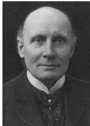
Альфред Норт Уайтхед

Теория хаоса и динамика сложных систем могут быть примерами мощных парадигм, в рамках которых снимаются кажущиеся противоречия нашего мира. Разум и душа не стремятся отделиться друг от друга, потому что они работают вместе каждый день. Это сотрудничество