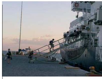
Февраль 2004. Морская лаборатория Института Скриппса проводит крупнейшие работы по ЭМЗ (НИС «Roger Revelle»)

крупных объектов. При согласии Statoil продолжать эту программу, следует провести полевые испытания ...»