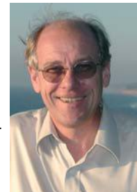
Проф. Стив Констебл

методов, в то время некоторой закрытой области даже для Кокса, более известного, как океанограф. Перед приездом Констебла, в 1981 г. Кокс опубликовал статью по морской электроразведке с контролируемым источником (русский эквивалент – ЗС-ЗИ), посвященную опытным работам Восточно-Тихоокеанском поднятии. Предметом исследования тогда была океанская литосфера.