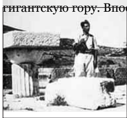
1924 Ардито Дэцио на о-вах Додеканезе

Покорение К2- это, конечно, то, что больше всего прославило Дэцио. Этот подвиг стал частью души Ардито, поскольку он был совершен по прошествии 25 лет после первой попытки. На протяжении этих долгих 25 лет он постоянно возвращался к мысли о том, как можно покорить эту гигантскую гору. Впоследствии