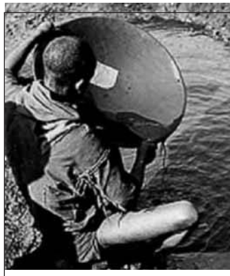
Поиск золота в Юбдо

Изначально обнаруженная в горе Дан, Новая Зеландия, она была названа так в 1859 г. геологом Кристианом Готлибом Хохштеттером. Порода, которая легко распадается на серпентин, является важным источником меди, магния и платины. Дунит обычно встречается в почве угольных пластов или в горизонтальных прослойках между другими горными породами, он может появляться как дайки и лакколиты. Возможно, он образуется из плотного скопления кристаллизованных гранул оливина, который оседает в кварцевой магме.