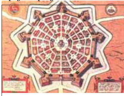
Карта Палманова и вид с воздуха.

форму звезды. Он был основан в 1593 году республикой Венецией для укрепления ее восточных границ от турецких и австрийских нашествий. Существовало три рода укреплений: первое и второе из них были построены Венецией, а третье – Наполеоном Бонапартом. Поэтому не только имя, которым был наречен Дэцио, но и сам город, где он был рожден, оказался «звездным». А для тех, кто увлекается астрологией, будет нелишним отметить, что по знаку зодиака этот человек был тельцом, а, как известно, телец – это знак силы, решительности и мужества. Все эти качества Дэцио неоднократно демонстрировал на протяжении своей жизни, в которой ему сопутствовала фортуна.