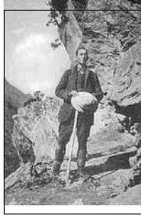
Луиджи Амедео герцог Абрुцци (1873-1933)