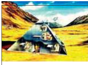
Схема пирамиды Дэцио

В 1989 г. две итальянские компании предложили 92-летнему Дэцио сделанную из стекла и алюминия пирамиду площадью фундамента в 1322м. (43 фт) и высотой в 840м. (27 фт). Эта пирамида должна была выполнять две функции: служить горным «убежищем» и быть передовой лабораторией для проведения исследований в области медицины, биологии, геонаук и окружающей среды. В 1990 г. пирамида была транспортирована в Лобуче в сагарматский (Сагарматха – непальское название Эвереста) национальный парк. Она была установлена на высоте 5050 м. (16564 фт) над уровнем моря и была