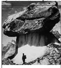
1929 Ледник Гриб в Бальторо

К2. Было решено начать восхождение. Практически в течение месяца Луиджи пытался покорить гору; он подступался к ней с юга, востока и запада. Ему пришлось признать поражение. Тогда Луиджи попытался покорить вершину Брайд (7654 м./25105 фт). Добраться до нее ему снова не удалось, однако он дошел до отметки в 7489 м. (24594 фт). На тот момент никому в мире еще не удавалось взобраться так высоко. Луиджи превзошел ближайшего «соперника» на 213м. (700 фт). Позже в 1919 г. выдающийся принц Луиджи Амадео основал в итальянском Сомалиленд деревню, которая была названа фермерской деревней герцога Абруцци. Она располагалась на реке Йеби Скебели. Ее исследовал и нанес на карту сам принц. Луиджи, почувствовав приближение своей смерти, покинул Рим и отправился в деревню, где 18 марта 1933 г. скончался в возрасте 60 лет. Его тело покоится там же, а последней просьбой жителей и по сей день является желание быть похороненным рядом с Луиджи, в образе которого воплотилась преданность, основанная на уважении к человеку. Отдавая дань уважения принцу, премьер-министр Италии Бенито Муссолини сказал, что от бескрайних и пустынных просторов полюса до неприступных вершин гор, от штормящих глубин океанов до негостеприимных земель Африки, герцог Абруцци всегда демонстрировал свой боевой дух. Готовясь к длинным путешествиям по морям мира, с самых юных лет он научился быть человеком железного мужества и крепкого терпения.