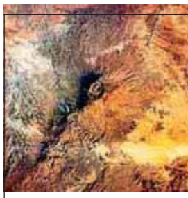
Тибести, Эми Кусси

Тибести лежит в 1000 км от Средиземного моря и в 2000 км. от Гвинейского залива. Это знаменитая горная система. Ее самая высокая точка называется Эми Кусси (3415м./11201фт.). Тибести окружен пустыней. Район, размер которого составляет 1/3 от размеров Италии, является обычным биологическим, населенном людьми островом.