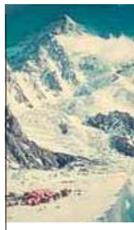
1954: К2 и базовый лагерь