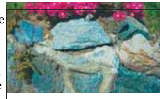
Голубой сланец