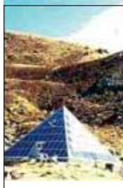
Пирамида Дэцио у подножия Гималаев