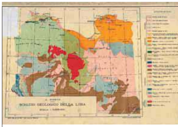
Геологическая карта-схема Ливии по А.Дэцио, 1936

месторождения нефти и газа. Это были первые месторождения углеводородов, найденные в Ливии.