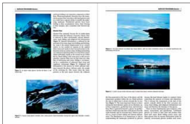
Страница из красочно иллюстрированной новой энциклопедии.