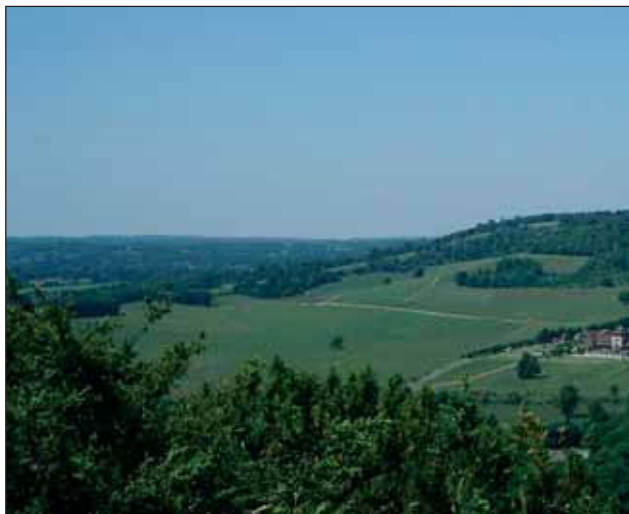
Вид на дом Селли: Денбис Эстейт, самая крупная винодельня в Англии.

Он неодобрительно относился к тем факту, что единственный диплом с отличием по геологии открывает доступ к тому, что он называет «могу-все-по-чуть-чуть». Диплом может включать немного геологии совместно с геофизикой, инжинирингом и изучением экологии. С его точки зрения геоученые могут иногда испытывать недостаток фундаментальных геологических знаний.