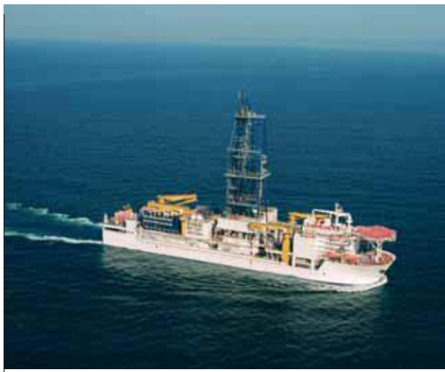
Chikyu в море. (фото: центр глубинной земной разведки, японское агентство морских и земных наук и технологий).

В ходе бурения и сопутствующих измерений предполагается затронуть следующие вопросы: 1) получение метана преимущественно при микробиологических процессах в толстых осадочных отложениях в вертикальном направлении; 2) верхняя транспортировка метана через проницаемые разломы регионального гранометрического масштаба, вызванные тектонической консолидацией аккреционной призмы; 3) включение метана в слои гидратов над придонным отражающим горизонтом, или в локальные концентрации на поверхности дна или вблизи его, возможно, через сфокусированные струи или каналы; 4) утечка метана из гидрата из-за верхней диффузии и 5) окисление и слияние метана в донном карбонате или выброс в океан. Количество гидратов в локальных скоплениях вблизи дна особенно важно для понимания влияния морских гидратов на изменение климата.