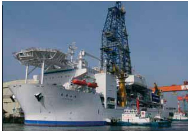
«Райзер» Chikyu.

установить датировку основных событий осадконакопления и рассчитать время схода оползней (бассейн Urza); и (4) понять турбидитные процессы осадконакопления.