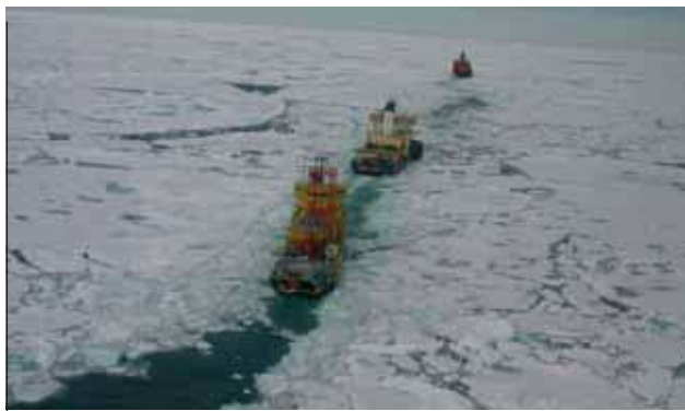
Арктическая экспедиция.