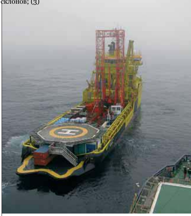
Судно Vidar Viking- платформа для выполнения специальных заданий (фото: Европейский консорциум по исследовательскому океаническому бурению).

Экспедиция также поможет (1) понять, как проницаемость, сжимаемость и скорость осадконакопления влияют на генерацию аномально высокого давления; (2) проконтролировать устойчивость склонов; (3)