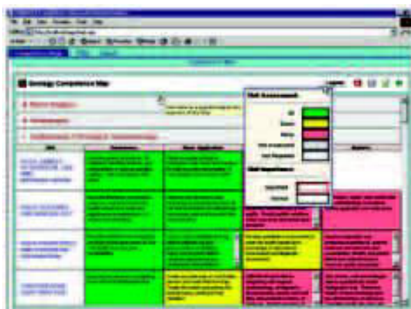
Рис. 4. Пример достижения компетентного

менеджмента путем описания индивидуальных способностей выявления и устранения пробелов в компетенции.