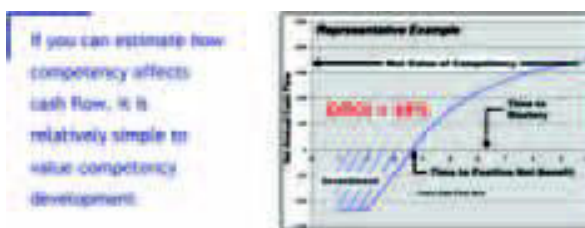
Рис. 2. Пример стоимости улучшенной компетентной